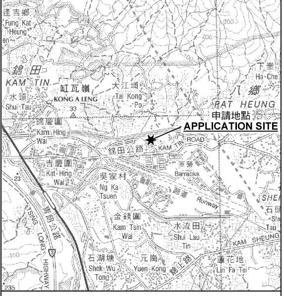
要覽圖 KEY PLAN SCALE 1 : 50 000 比例尺

申請地點界線只作識別用 APPLICATION SITE BOUNDARY FOR IDENTIFICATION PURPOSE ONLY