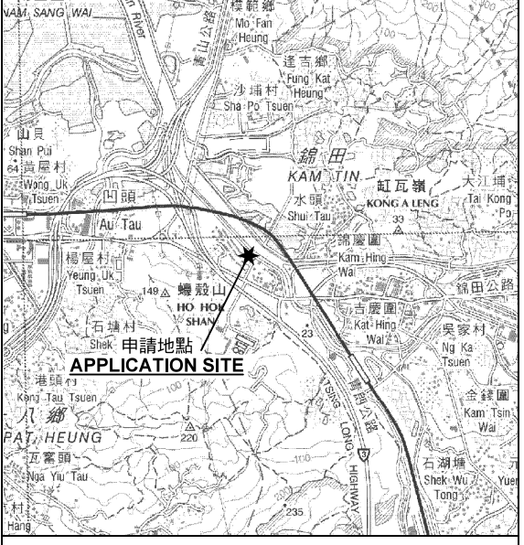
要覽圖 KEY PLAN SCALE 1 : 50 000 比例尺

申請地點界線只作識別用 APPLICATION SITE BOUNDARY FOR IDENTIFICATION PURPOSE ONLY