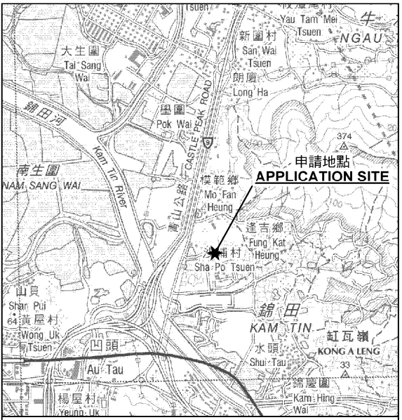
要覽圖 KEY PLAN SCALE 1 : 50 000 比例尺

申請地點界線只作識別用 APPLICATION SITE BOUNDARY FOR IDENTIFICATION PURPOSE ONLY