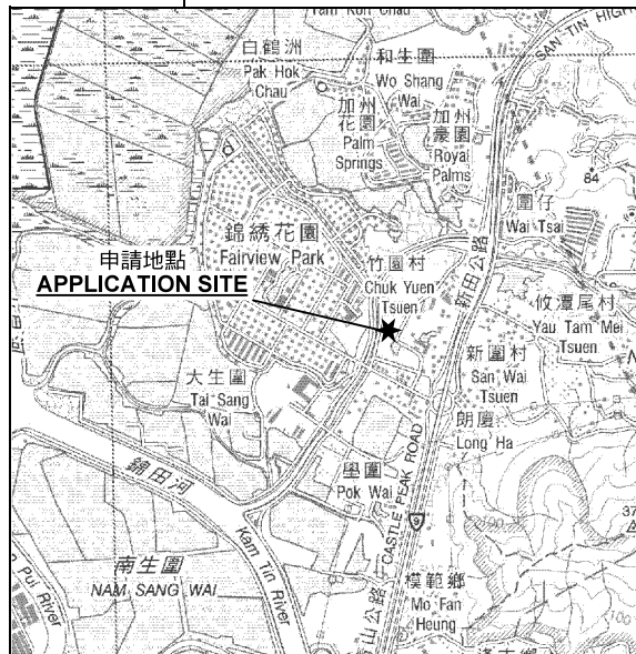
要覽圖 KEY PLAN SCALE 1 : 50 000 比例尺

申請地點界線只作識別用 APPLICATION SITE BOUNDARY FOR IDENTIFICATION PURPOSE ONLY