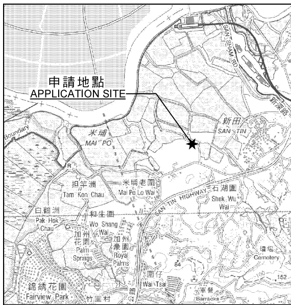
要覽圖 KEY PLAN