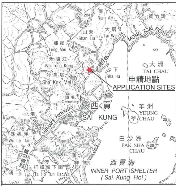
要覽圖 KEY PLAN SCALE 1 : 50 000 比例尺