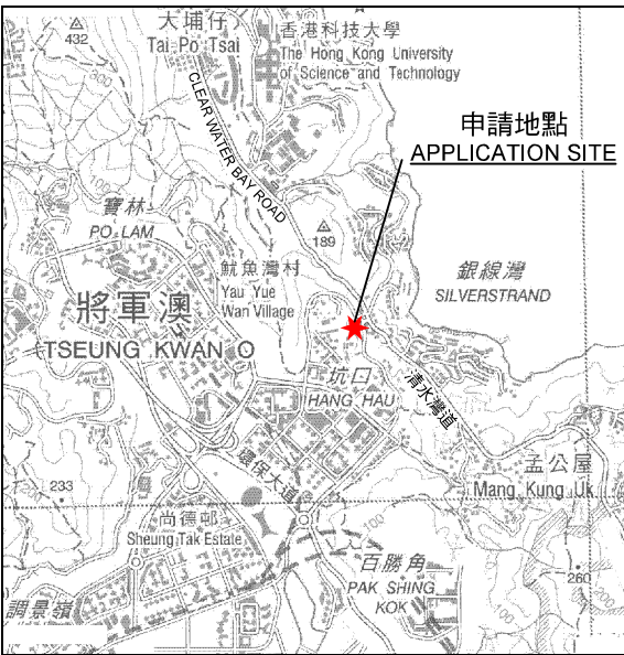
要覽圖 KEY PLAN SCALE 1 : 50 000 比例尺