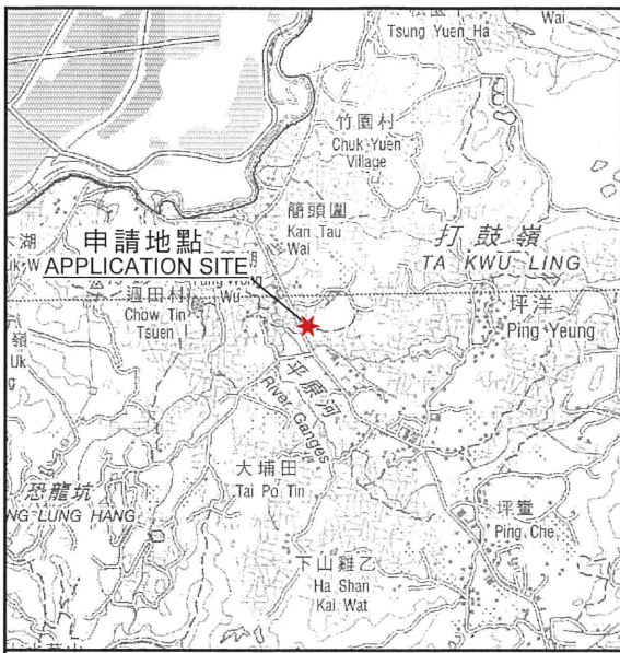
要覽圖 KEY PLAN