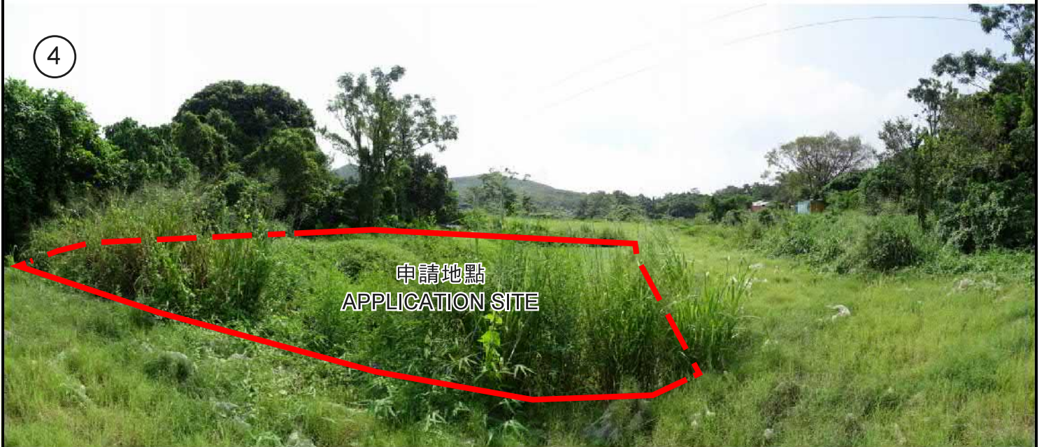
池塘 2 POND 2

申請地點界線只作識別用 APPLICATION SITE BOUNDARY FOR IDENTIFICATION PURPOSE ONLY