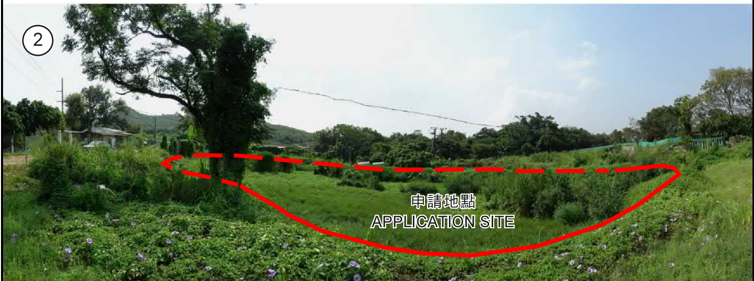
池塘 1 POND 1

申請地點界線只作識別用 APPLICATION SITE BOUNDARY FOR IDENTIFICATION PURPOSE ONLY