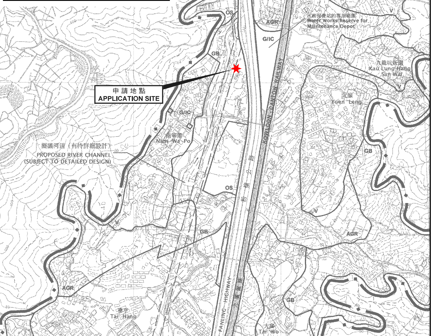
位置圖 LOCATION PLAN

本摘要圖於2020年10月6日擬備， 所根據的資料為於2006年10月17日核准的 分區計劃大綱圖編號S/NE-KLH/11 EXTRACT PLAN PREPARED ON 6.10.2020 BASED ON OUTLINE ZONING PLAN No. S/NE-KLH/11 APPROVED ON 17.10.2006