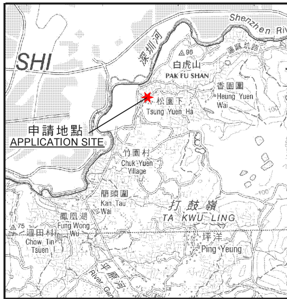
要覽圖 KEY PLAN SCALE 1 : 50 000 比例尺