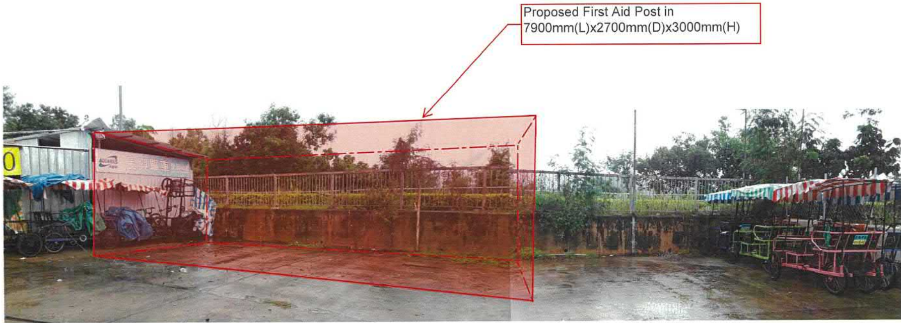
Site Frontage View