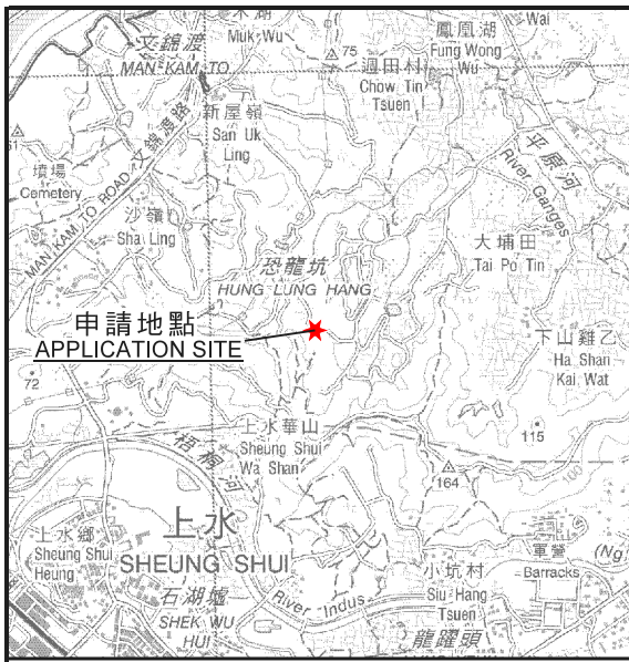
要覽圖 KEY PLAN SCALE 1 : 50 000 比例尺