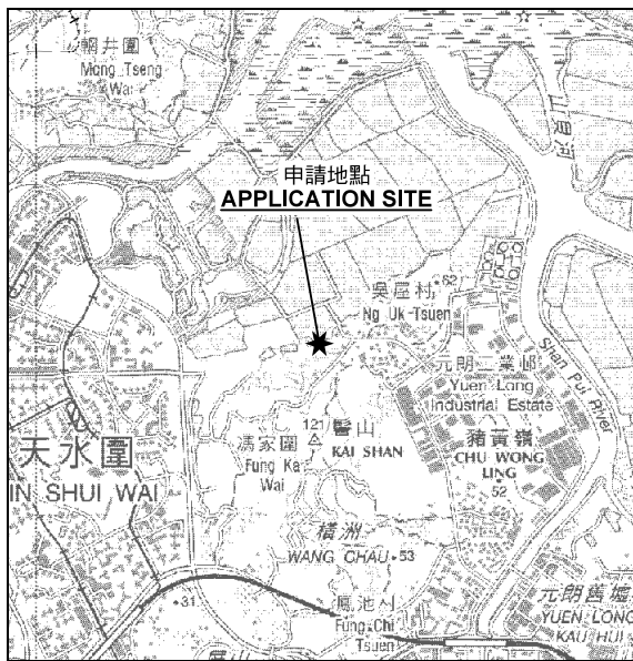
要覽圖 KEY PLAN