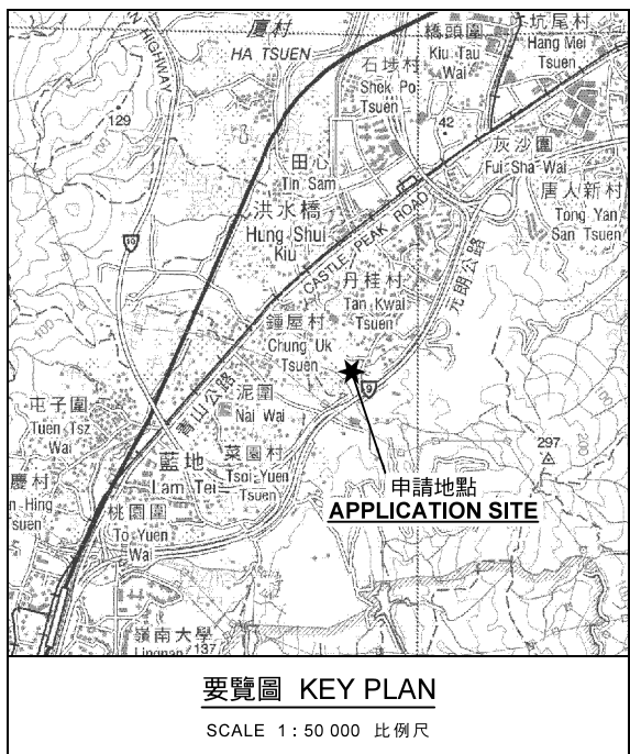
要覽圖 KEY PLAN SCALE 1 : 50 000 比例尺