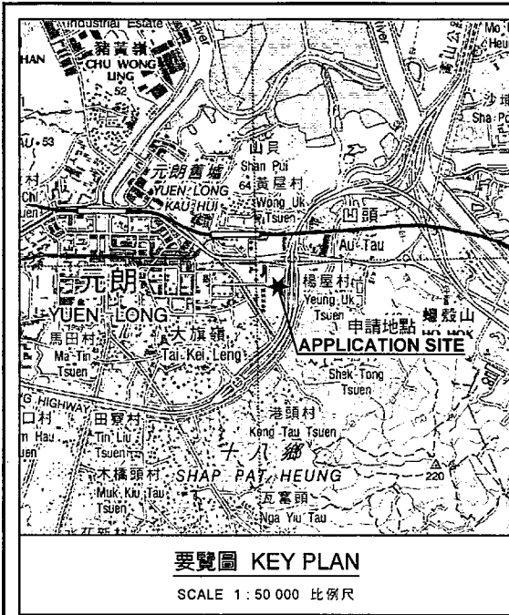
要覽圖 KEY PLAN SCALE 1 : 50 000 比例尺