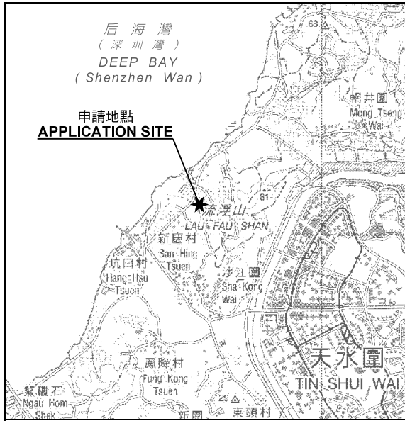
要覽圖 KEY PLAN