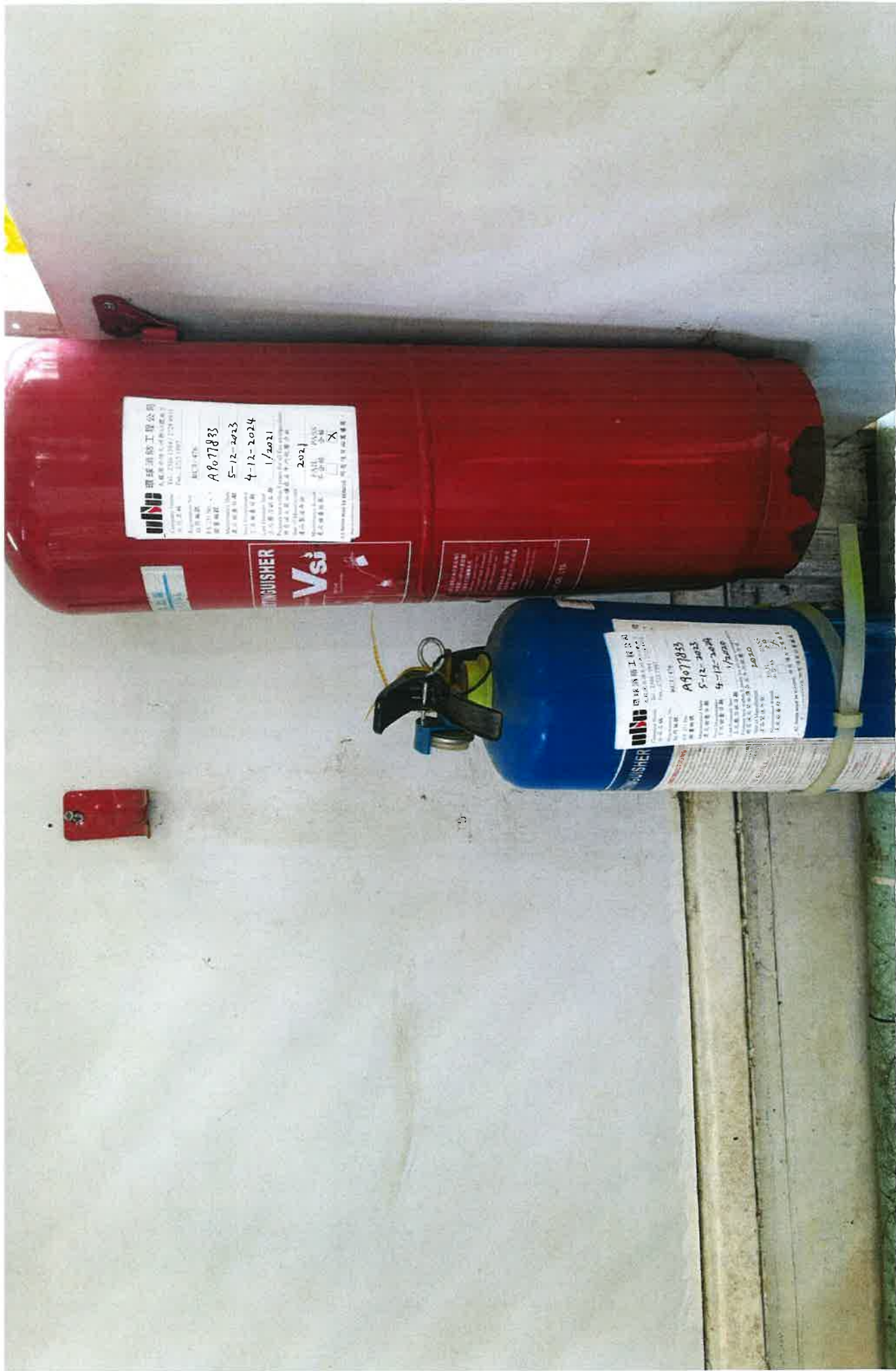
圖(1,2) 上層辦公室放置 1 個 9 公升 CO2 和 1 個 4kg Dry Power 滅火桶