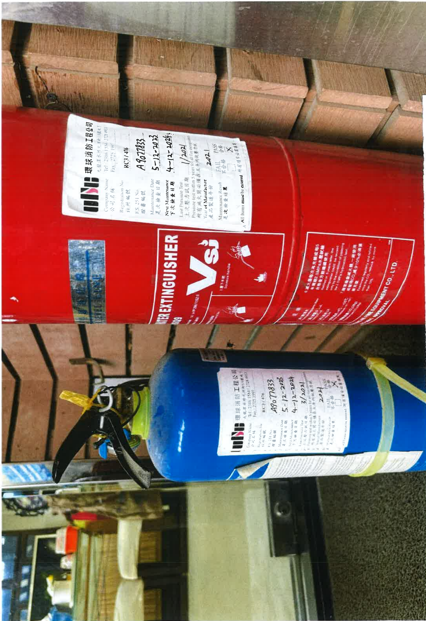
圖(3.4) 下層會議室放置 1 個 9 公升 CO2 和 1 個 4kg Dry Power 滅火桶