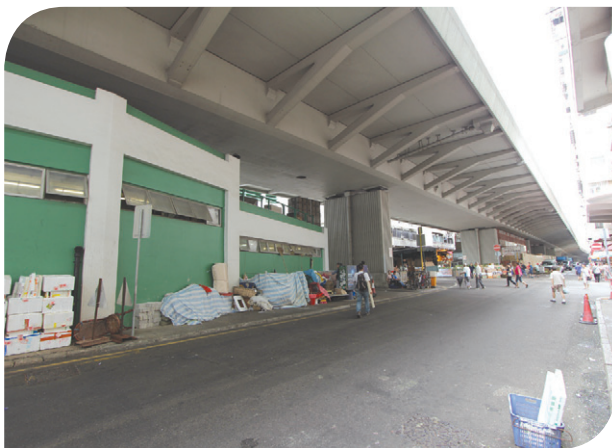
九龙城现时街道环境 Existing Streetscape in Kowloon City