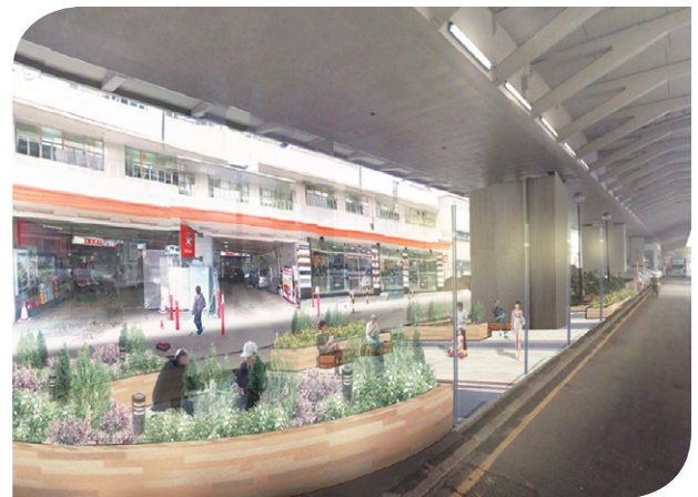
建议优化后的九龙城街道环境 Proposed Streetscape Enhancement in Kowloon City