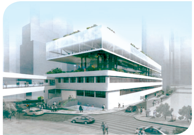
拟议的「城中绿洲」 Proposed 'Central Oasis'