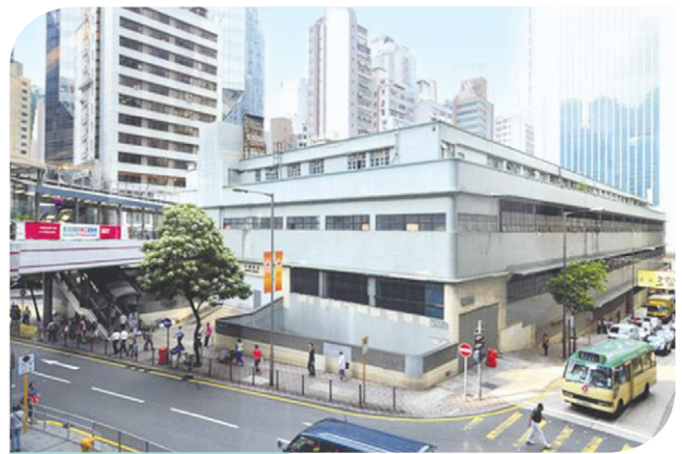
中环街市 Central Market

二零一三年七月十九日，城规会在有附带条件下批准了一宗规划申请（编号A/H4/92）。就该宗申请，申请人拟在现有建筑物进行加建工程，以提供文化/休憩/康乐/餐饮/零售用途/园景美化地方/附属设施，并申请略为放宽建筑物高度限制，以把中环街市活化成一座名为「城中绿洲」的低矮建筑物，作为区内提供休闲活动的地标。「城中绿洲」的发展会分两期进行，以维持建筑物二楼可连接半山自动扶梯与海滨高架行人道网络之间的公共通道。活化工程建议设置一个「园景美化中庭」，除园景美化设施及建筑特徵外，并无永久构筑物；以及一座提供各种文化、康乐、休憩、餐饮和零售服务设施供公众使用的「漂浮空间」，「漂浮空间」并可支撑其上面的另一层公众休憩用地。