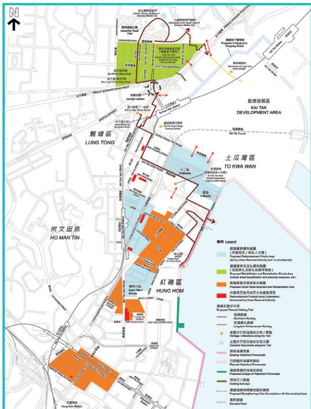
建议的九龙城市区更新计划 Recommended Urban Renewal Plan for Kowloon City

政府于二零一一年二月公布的《市区重建策略》，积极推动在市区更新的规划阶段实践「以人为本，地区为本，与民共议」的工作方针。提出在旧区设立「市区更新地区咨询平台」（下称「咨询平台」），以加强地区层面市区更新的规划。