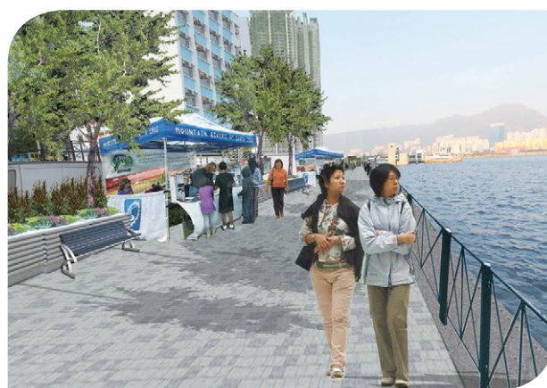
九龍城擴闊海濱長廊建議 Proposed Waterfront Promenade Widening in Kowloon City