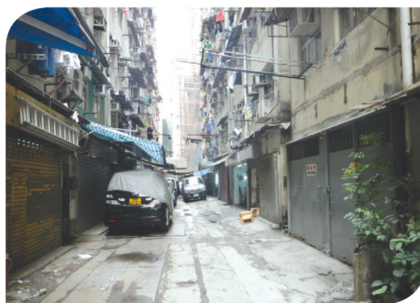
環字八街 Eight "Wan" Streets