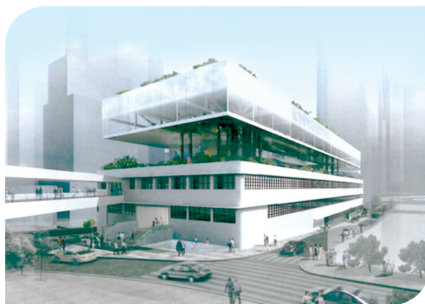
擬議的「城中綠洲」 Proposed 'Central Oasis'