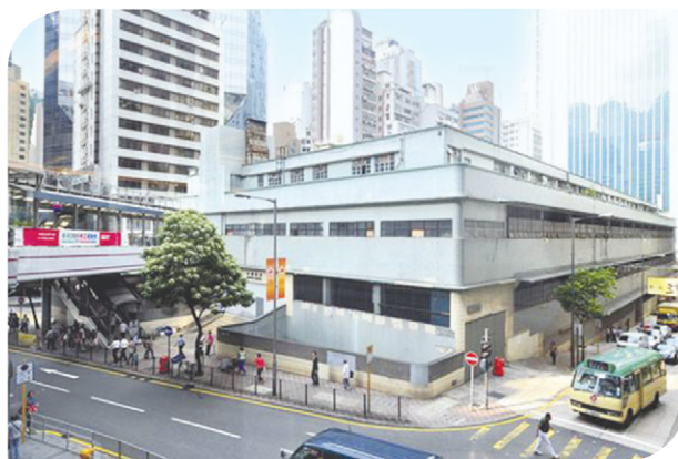
中環街市 Central Market

二零一三年七月十九日，城規會在有附帶條件下批准了一宗規劃申請（編號A/H4/92）。就該宗申請，申請人擬在現有建築物進行加建工程，以提供文化／休憩／康樂／餐飲／零售用途／園景美化地方／附屬設施，並申請略為放寬建築物高度限制，以把中環街市活化成一座名為「城中綠洲」的低矮建築物，作為區內提供消閒活動的地標。「城中綠洲」的發展會分兩期進行，以維持建築物二樓可連接半山自動扶手電梯與海濱高架行人道網絡之間的公共通道。活化工程建議設置一個「園景美化中庭」，除園景美化設施及建築特徵外，並無永久構築物；以及一座提供各種文化、康樂、休憩、餐飲和零售服務設施供公眾使用的「漂浮空間」，「漂浮空間」並可支撐其上面的另一層公眾休憩用地。