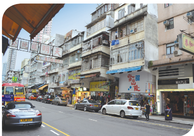
獅子石道 Lion Rock Road