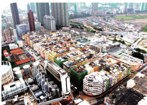
「十三街」 "13 streets"

當局在二零一四年一月向政府提交《九龍城市區更新計劃》。九龍城諮詢平台任期亦於二零一四年五月屆滿。